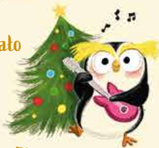
Pingwini taniec dookoła choinki