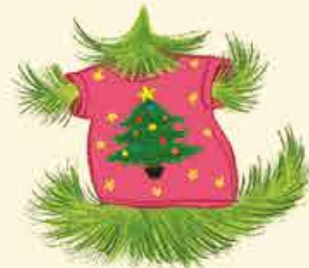
Koszulka do jodłowania