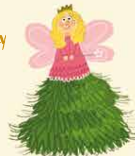
Drzewko z wróżką