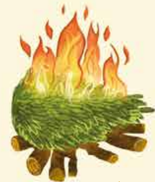
Płonące jodlisko w lesie