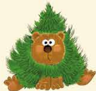
Jodła niepospolita (nieprawdziwa)