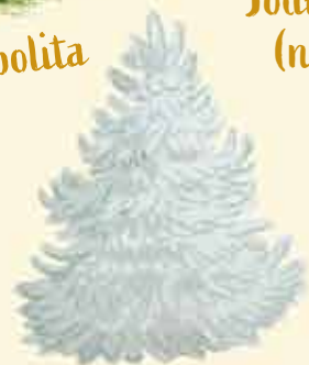
Jodła cała na biało