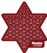
2 plansze w kształcie gwiazd