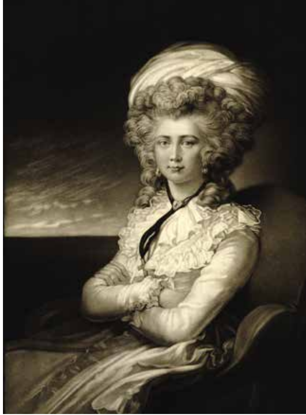
6. Valentine Green, Maria Cosway według autoportretu artystki z 1787 roku, po 1787. British Museum, Londyn

małżonka, a może również i patriarchalnym normom. To za sprawą autoportretów przyspilony cień staje się realniejszym kształtem.