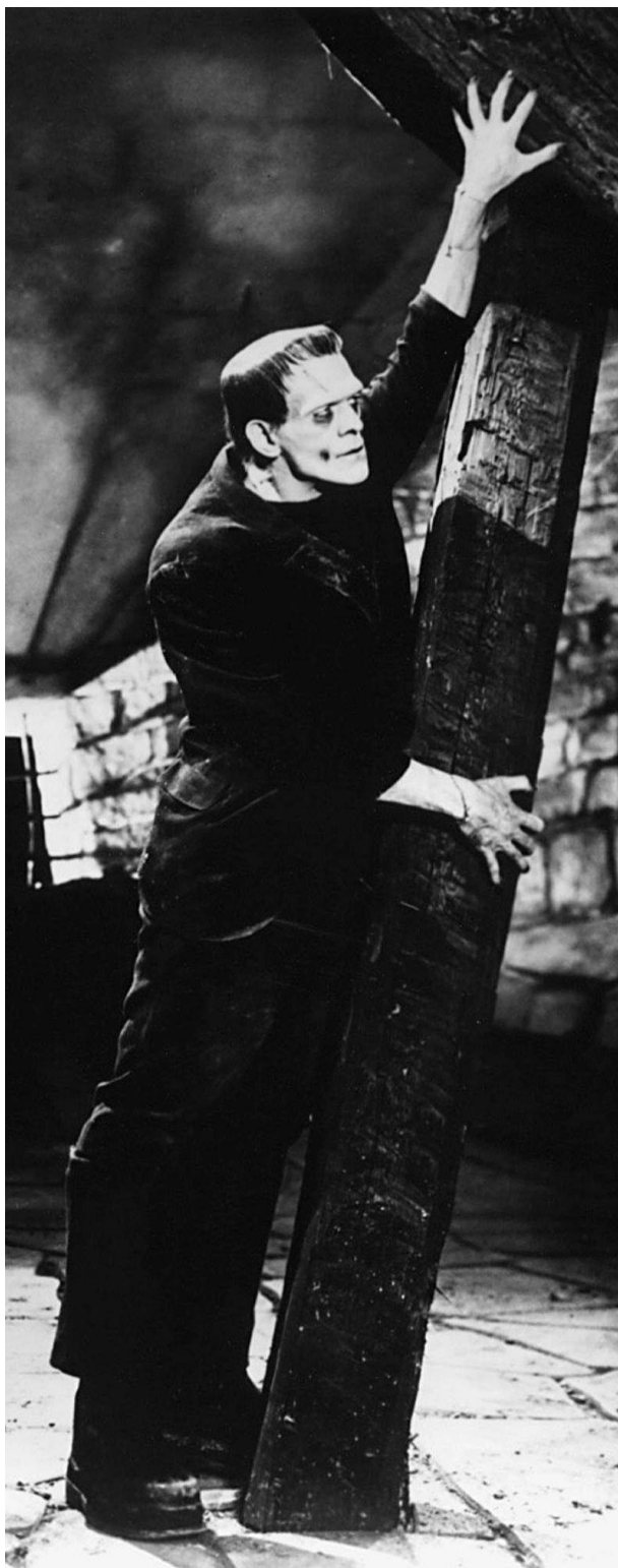
Boris Karloff, „Frankenstein”, 1931 r., reż. James Whale, Universal Pictures, USA

Tragiczna historia szalonego doktora i jego monstrem, ma swój początek w prekursorskiej powieści gotyckiej z pogranicza horroru, fantastyki naukowej i czarnego romantyzmu - „Frankenstein, czyli współczesny Prometeusz” 1 , autorstwa niespełna dwudziestoletniej Mary Shelley. W świadomości zbiorowej Frankenstein należy jednak zdecydowanie do świata filmu i na stałe wpisał się właśnie do historii X muzy, stając się jedną z najbardziej rozpoznawalnych ikon kina grozy i kultury popularnej wszech czasów. W trakcie ponad stuletniej przygody z kinem, począwszy od pierwszej filmowej wersji z 1910 roku, na powieści Mary Shelley dokonywano szeregu skrótów, uproszczeń i zmian, niekiedy bardzo daleko idących; doktor zyskał garbatego asystenta, a Frankensteinem kilkakrotnie była kobieta. Do bezimiennej postaci nieszczęśliwego potwora, z biegiem lat przyłgął przydomek Frankenstein; wszak to wynalazek, miał, zatem pełne prawo zostać ochrzczony nazwiskiem wynalazcy, który sam nie nadał mu imienia. Alois Alzheimer, James Parkinson, Georges Gilles de la Tourette... Wiktor Frankenstein swoim nazwiskiem firmuje kolejne utrapienie ludzkości .